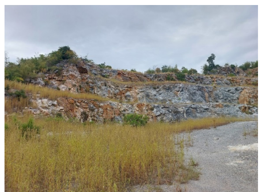
ลักษณะภูมิประเทศพื้นที่โครงการ